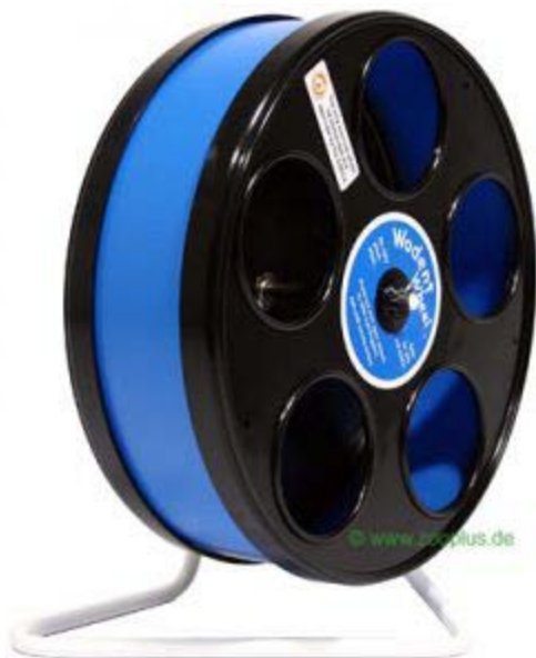
Ruota Wodent Wheel Ø 20 cm

Il diametro di 20cm è particolarmente adatto per criceti e piccoli roditori di massimo 12 cm di lunghezza, tranne che per ottodonte (degus) e topi.